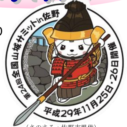
(さのまる)